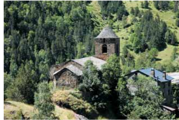
Sant Pere d'Os de Civís

Continuem remuntant el carrer major i a la sortida de capdemunt del poble es troba l'església romànica de Sant Pere, restaurada fa pocs anys. Aquesta tenia un valuós mural pintat al fresc, d'origen gòtic, que es pot contemplar al Museu Diocesà d'Urgell.