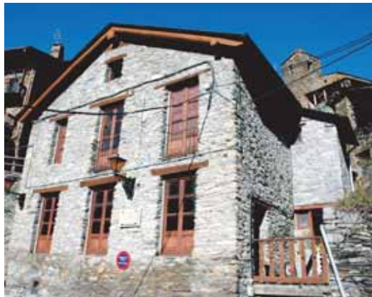
Centre d'Interpretació de les Terres de Frontera

L'itinerari comença al bonic poble d'Os de Civís, accessible per carretera sols des d'Andorra. Tot remuntant el carrer major ens acostem al futur Centre d'Interpretació de les Terres de Frontera, situat a l'antiga escola del poble. Aquest versarà sobre les relacions transfrontereres, que hi han hagut al llarg de la història, entre valls pirinenques del Parc Natural de l'Alt Pirineu i els estats d'Andorra i França. Es preveu que sigui visitable a partir de l'any 2008.