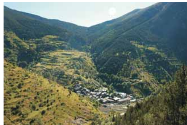
Os de Civís, amb el coll de Montaner al fons

- Passat el coll de Conflent, trobem aquest nucli de bordes, testimoni de la intensa activitat ramadera d'anys passats que hi havia a la zona. Presenta una ermita i una petita àrea d'esbarjo.