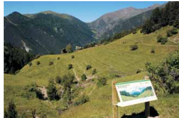
Mirador de Borda Cremada, amb el coll de Confent al fons

Sortint del poble, deixem el camí de Setúria, i seguim el camí que manava cap a la Cultia, antiga zona de cultiu agrícola del poble, que per abandó s'ha transformat en prats i pastures. Travessat el torrent de Montaner ens endisem pel bosc fins a les Feixes de les Traves, des d'on s'observa una bonica panoràmica del poble. Tornem a endinsar-nos en un tupit bosc de pi negre i avet, fins al mirador de borda Cremada, punt més alt del recorregut. A partir d'aquí el camí descendeix per antigues feixes boscadades de ginebrons i pi roig fins arribar novament a les Culties. A partir d'aquí es segueix en baixada, el mateix recorregut fet anteriorment de pujada, fins al poble d'Os de Civís.